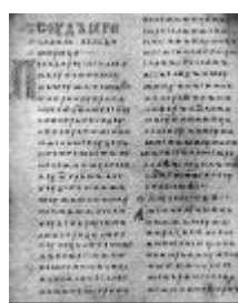
Двинская уставная грамота

Лихоимец – жадный вымогатель, взяточник».