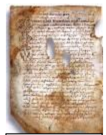
Псковская судная грамота

Двинская уставная грамота 1397 года. Мздоимство упоминается в русских летописях XIV века, например в Двинской уставной грамоте 1397 года в статье 6: «А самосуда четыре рубли, а самосуд то: кто изыснав татя с поличным, да отпустит, а себе посул возьмет, а наместники доведаются по заповеди, ино то самосуд, а опричь того самосуда нет». Там же, в статье 8: «...а черес поруку не ковати, а посула в железех не просити; а что в железех посул, то не в посул».