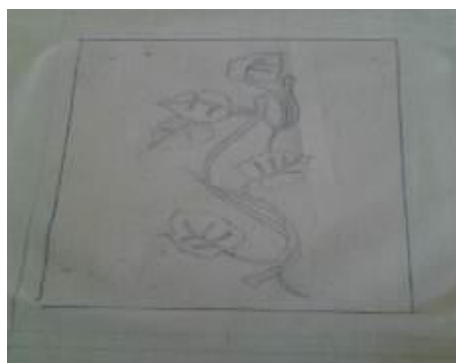
Рис.2.Контур рисунка на ткани