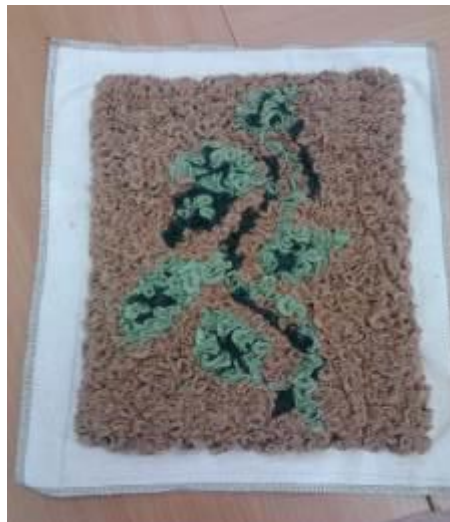
Рис. 6. Освобождение готового изделия от пялец