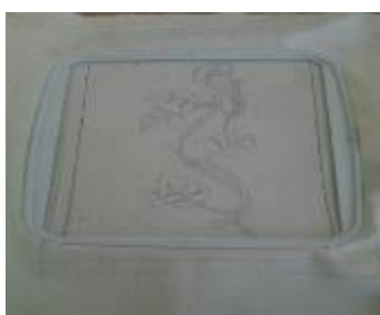
Рис. 4. Закрепление основы в пальцы