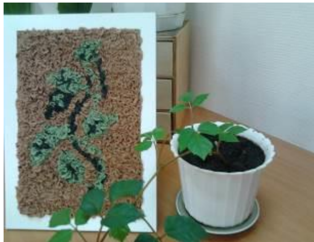
Рис. 7. Готовое панно в рамке