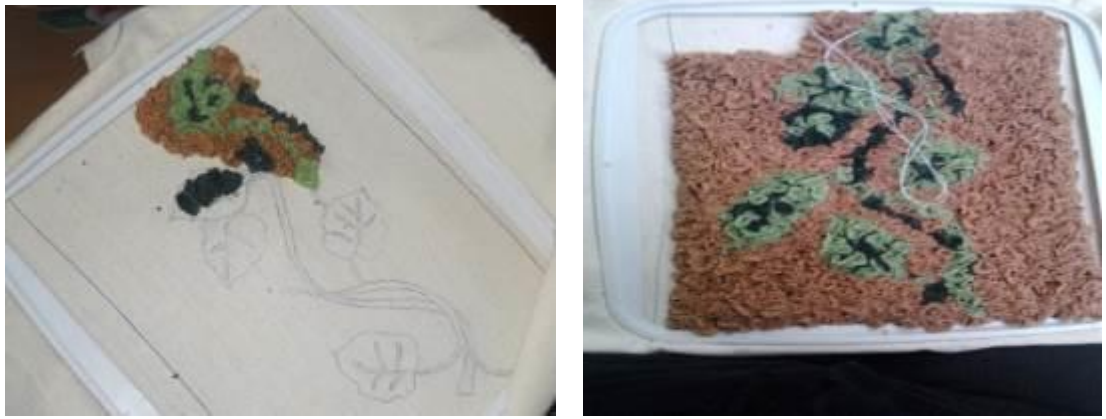
Рис.5. Прикрепление аппликации к основе