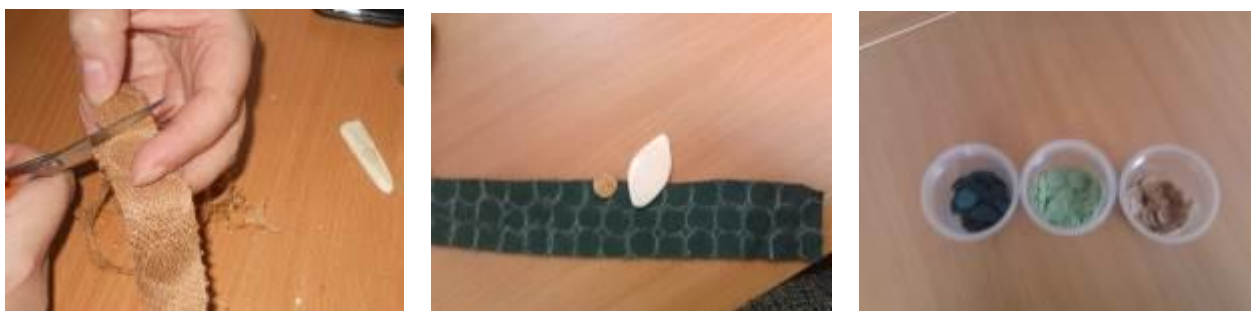
Рис. 3. Вырезание круглых заготовок для аппликации